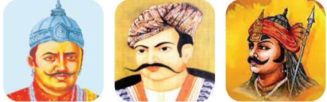
राजा नाहर सिंह