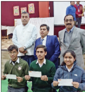
भिवानी। अतिथियों के साथ विजेता विद्यार्थी।

विद्यालय के विद्यार्थियों ने राज्य स्तरीय विज्ञान प्रश्नोत्तरी में चौथा स्थान प्राप्त कर जिला व