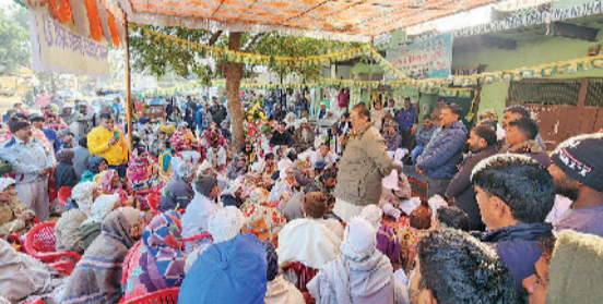
चरखी दादरी। ग्रामीणों को संबोधित करते डॉ. अजय चौटाला।

दादरी जिला मेरी कर्मभूमि है। दादरी जिला वासियों ने सदैव हम अपना सहयोग, समर्थन और आशीर्वाद दिया है। मेरी रगों में भी चौ. देवीलाल का खून है। दादरी जिले के सम्मान को कभी ठेस नहीं पहुंचने दूंगा। यह बात जेजेपी के राष्ट्रीय अध्यक्ष डॉ. अजय सिंह चौटाला ने आज जनसंपर्क अभियान के तहत बाढ़ड़ा विधानसभा क्षेत्र के गांव ढाणी फौगाट, दातौली, मंदौला, पालड़ी, बधवाना, दगडौली और नांधा में ग्रामीण जनसभाओं को घोषणा की। ग्रामीण जनसभाओं को संबोधित करते हुए डॉ. अजय सिंह चौटाला ने गांव दूधवा से दातौली होते हुए चिड़िया तक सड़क का नवनिर्माण करवाने की घोषणा की। इसके अलावा गांव पालड़ी वासियों की