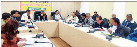
चरखी दादरी। लघु सचिवालय के सभागार में दिशा कमेटी की बैठक लेते सांसद धर्मवीर सिंह।

सांसद धर्मवीर सिंह ने कहा है कि जिला में करवाए जा रहे सभी विकास कार्यों में तेजी लाई जाए और कामों को समय पर पूरा करवाया जाए। सांसद वीरवार को लघु सचिवालय के सभागार में दिशा कमेटी की बैठक ले रहे थे। उन्होंने कहा कि दिशा कमेटी की बैठक उन उद्देश्य केंद्र व राज्य सरकार की ओर से करवाए जा रहे विकास कार्यों की प्रगति की समीक्षा