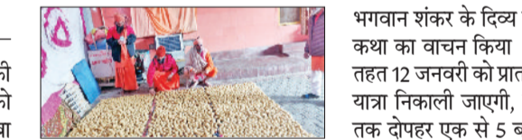
बाबा जहरगिरी दातार की पुण्यतिथि पर आयोजित वार्षिक भंडारे के लिए प्रसाद बनना हुआ शुरू

परमहंस बाबा जहरगिरी दातार की पुण्यतिथि के अवसर पर 19 जनवरी को हालुवास गेट स्थित सिद्धपीठ बाबा जहरगिरी आश्रम में आयोजित होने वाले वार्षिक भंडारे एवं संत समागम की आकर आहुति दी। कार्यक्रम की श्रृंखला में बच्चों ने सुंदरकांड पर आधारित अंताक्षरी का आयोजन भी किया, जिसमें बच्चों के साथ-साथ बड़ों बुजुर्गजनों ने भी बह-चढ़कर भागीदारी की। आश्रम के प्रवक्ता ने बताया कि 12 जनवरी शुक्रवार को सायं 3 बजे 6 बजे तक 151 सुंदरकांड पाठ का आयोजन, 13 जनवरी शनिवार को वृद्ध सम्मान व लोहड़ी महोत्सव 3 बजे से 6 बजे तक, 14 को माता की चौकी 2 से 6 बजे तक आयोजित की जाएगी।