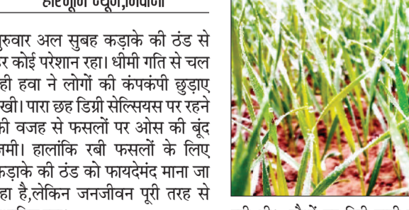
गुरुवार अल सुबह कड़ाके की ठंड से हर कोई परेशान रहा। धीमी गति से चल रही हवा ने लोगों की कंपकंपी छुड़ाए रखी। पारा छह डिग्री सेल्सियस पर रहने की वजह से फसलों पर ओस की बूंद जमी। हालांकि रबी फसलों के लिए कड़ाके की ठंड को फायदेमंद माना जा रहा है, लेकिन जनजीवन पूरी तरह से प्रभावित रहा।

दस बजे धुंध के बादल छंटने शुरू तो सूर्यदेव की ताक झाक शुरू हुई। सूर्यदेव के दर्शनों के बाद लोगों को लगा कि धूप खिलेगी। उसके दस मिनट बाद सूर्यदेव ने चटक धूप बिखरनी शुरू कर दी। धूप खिलने के बाद लोगों को ठंड से राहत मिलनी शुरू हुई। तभी लोगों की दिनचर्या पटरी पर लौटी। फसलों के लिए फायदेमंद कड़ाके की ठंड फसलों के लिए फायदेमंद मानी जा रही है। ठंड में ही रबी फसलों में फायदा होगा। फसलों में बने फुटाव जल्दी ही बढ़ने लगेंगे और उससे अनुपस्थान पैदावार बढ़ेगी। गेहूं व सरसों की फसल में सबसे ज्यादा फायदा होगा। इन फसलों में इस वक्त बेहतर न फुटाव बना हुआ है।