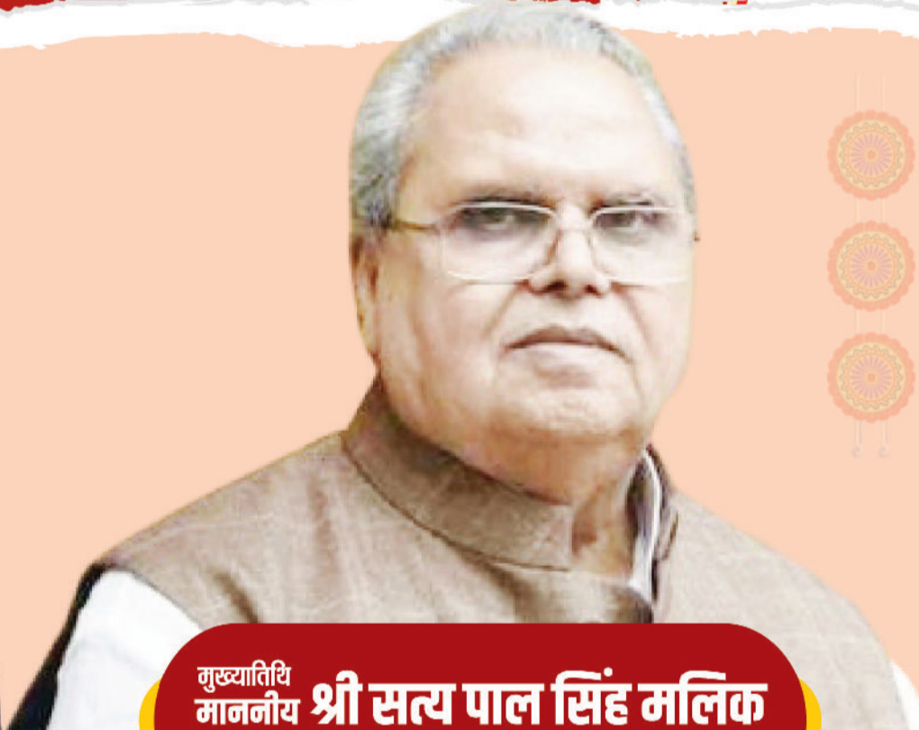
मुख्यातिथि माननीय श्री सत्य पाल सिंह मलिक प्रसिद्ध भारतीय राजनीतिज्ञ एवं पूर्व राज्यपाल- जम्मू कश्मीर, गोवा, बिहार एवं मेघालय