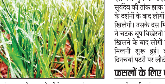
रही थी। पौधों पर गिरी पानी की बूंद जमने को आतुर नजर आई। चूँकि पारा लगातार जमाव बिंदू की तरफ लूढ़क रहा था। कड़ाके की ठंड की वजह से लोगों की कंपकंपी छुटती रही। धुंध की ज्यादा गहलता के चलते वहन फालकों को 20 मीटर से ज्यादा दूरी का नजर नहीं आ रहा था। वाहन चालक एक दूसरे वाहन के पीछे लग कर गंतव्य तक पहुंचे। लोगों को ठंड से बचने के लिए अलाव का सहारा लेना पड़ा। अलाव जलाकर लोगों ने अपने आप को ठंड से बचाने का प्रयास किया। दिन चढ़ने तक मौसम ठंडा ही रहा। करीब दस बजे के आसपास हवा ने थोड़ी सी गति पकड़ी तो धुंध के बादल छटकने लगे। साढ़े