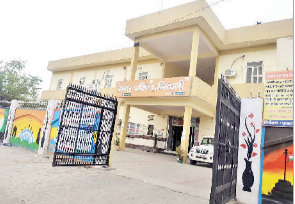
भिवानी। नगरपरिषद के भवन और शहर की संवारी गई दीवारों का दृश्य।

सफाई, स्वच्छता के संदेश व जागरूकता अभियान चलाने के तमाम प्रयासों के बावजूद स्वच्छता में थोड़ा सा सुधार हुआ है। सभी पहलुओं के जांच के बाद छोटी कांशी को प्रदेश में 16 वां रैंक हासिल हुआ है। स्वच्छता में सुधार होने के बाद मिवानी को ओडीएफ प्लस की श्रेणी में भी शामिल किया गया है। हालांकि अभी नेशनल स्तर पर रैंकिंग में सुधार करने की बेहद सख्त जरूरत है, लेकिन फिलहाल