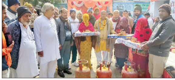
भिवानी। संकल्प यात्रा के दौरान गैस बुद्धे व सिलेंडर देते हुए।

नोडल मिश्रा ने यहां पर महिला एवं बाल विकास विभाग, कृषि विभाग, कल्याण विभाग, राजस्व विभाग, पशुपालन विभाग, क्रीडा, नेहरू युवा केंद्र आदि विभिन्न विभागों द्वारा स्टाल लगाई गई स्टालों का अवलोकन किया। उन्होंने अधिकारियों को जरूरी निदेश देते हुए कहा